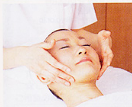
ゆったりと安らいで

(右から) クリアソープ.....1,580円 ディープクレンジングオイル.....3,150円 乳清パック.....2,940円